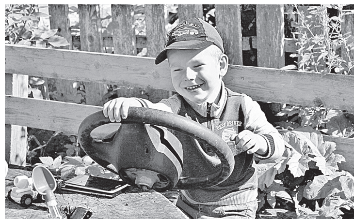
«Крепче за баранку держись, шофер!»