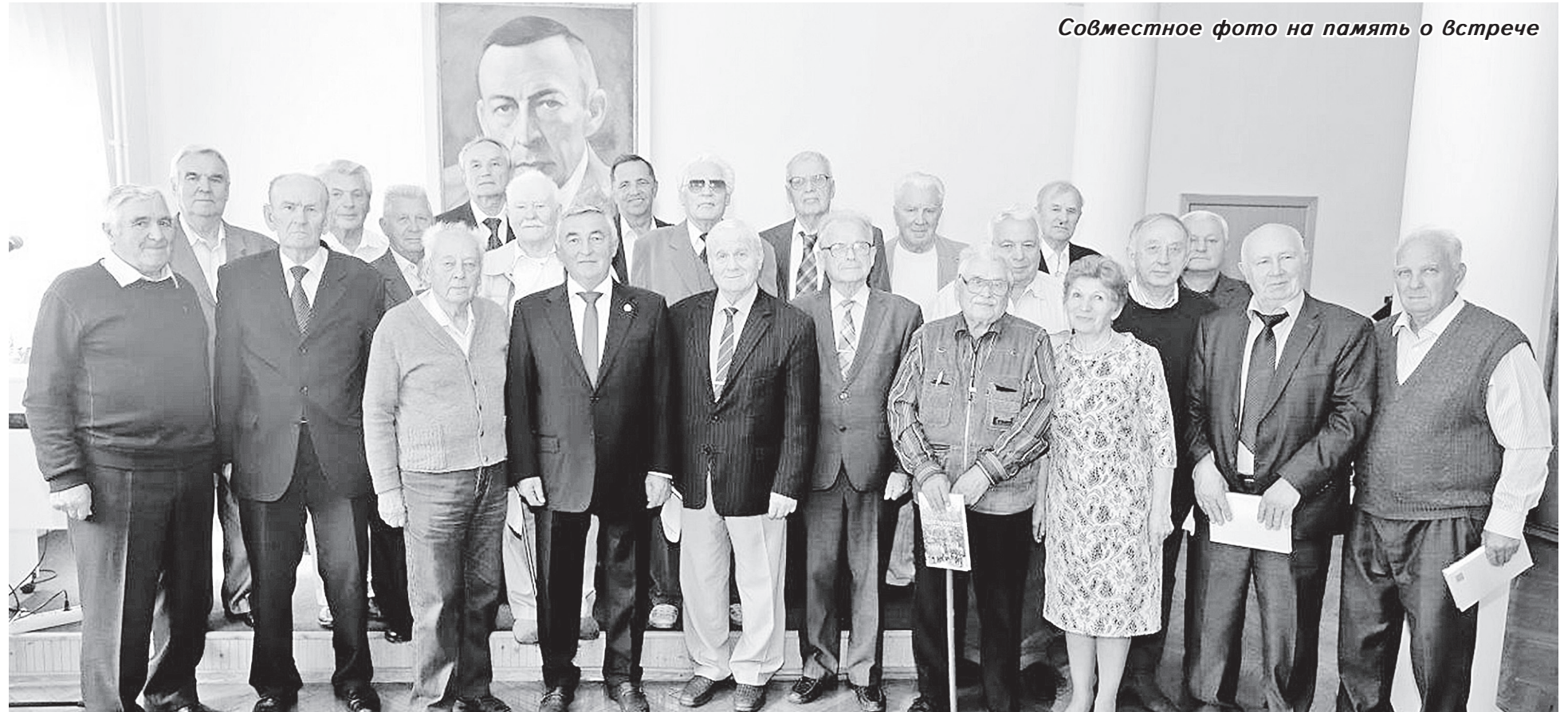
Совместное фото на память о встрече