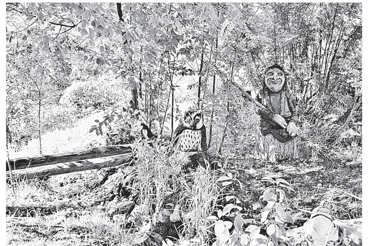
Вот такие сказочные герои «живут» в деревне Большие Леса!