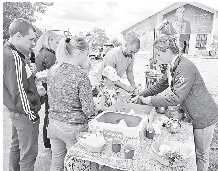
Чай из самовара с домашними пирожками — лучшее угощение на свежем воздухе!